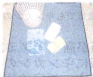
洗濯物をたたんで置いた所

特長は使う所がメッシュに成っています。花粉、PM2.5、黄砂、ホコリたたでいる時に落ちてメッシュの下に落ちて洗濯物に付着をしない事です。赤ちゃんのご家庭にピッタリ又ペットの抜け毛の付着も防げます。アイロン掛けの時にも使用出来ます、掛ける物を置いたり仕上げた物を置けばハウスダストの付着を防げます。お子さんの教育に役立ちます、子供さんの小さい時から一緒に洗濯物を取り入れたたり、たたむ楽しさを教えて置くで将来あなたが出来ない時に助かります。