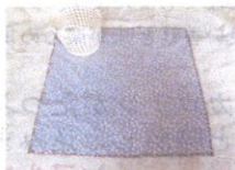
洗濯物をたたむ時に広げた所

今日から世界のご家庭の洗濯物をたたむ時の必需品です。洗濯物を室外に天日干しされた後、取り入れ時ランドリーフォーウルドパットの上に置けば洗濯物に付着している花粉、PM2.5、黄砂、ホコリなどの室内への飛散防止に役立ちます。今までは洗濯物を室内に取り入れた時、フローリング、たたみ、ジュウタンの上に直接置いてると思います。洗濯した物に室内に落ちているアレルギー物質(ダニ、ダニの糞、死骸)ハウスダストが付着する事を防ぐ事が出来ます。洗濯物をたたむ時に付着していた花粉、PM2.5、黄砂、ホコリ等が落ちてもランドリーフォーウルドパットを広げて使えばなるほど清潔安心です。あなた様がお出かけの時、公共の場で靴を脱ぎ歩いたり誰が履いたか分からないスリッパはばい菌だらけです。その足で家に帰り歩いた所に今までは洗濯物を置いていた事を思うと汚いと思いませんか。今からはランドリーフォーウルドパットの上に置けばなるほど清潔安心です。